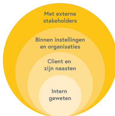
Figuur 3: Verantwoording als dialoog op verschillende niveaus

Het afleggen van verantwoording dicht bij de praktijk dient plaats te vinden op verschillende niveaus (zie figuur). Ten eerste vraagt dit om voortdurende zelfreflectie van professionals . Ten tweede vraagt het op het niveau van de zorgrelatie een dialogoog met de patiënt, cliënt en/of mantelzorger . Ten derde vraagt het een dialoog op het niveau van de organisatie, bijvoorbeeld tussen bestuurders en zorgprofessionals, en tussen afdelingen onderling. Ten vierde vraagt het om een dialogoog met externe partijen die actief meedenken.