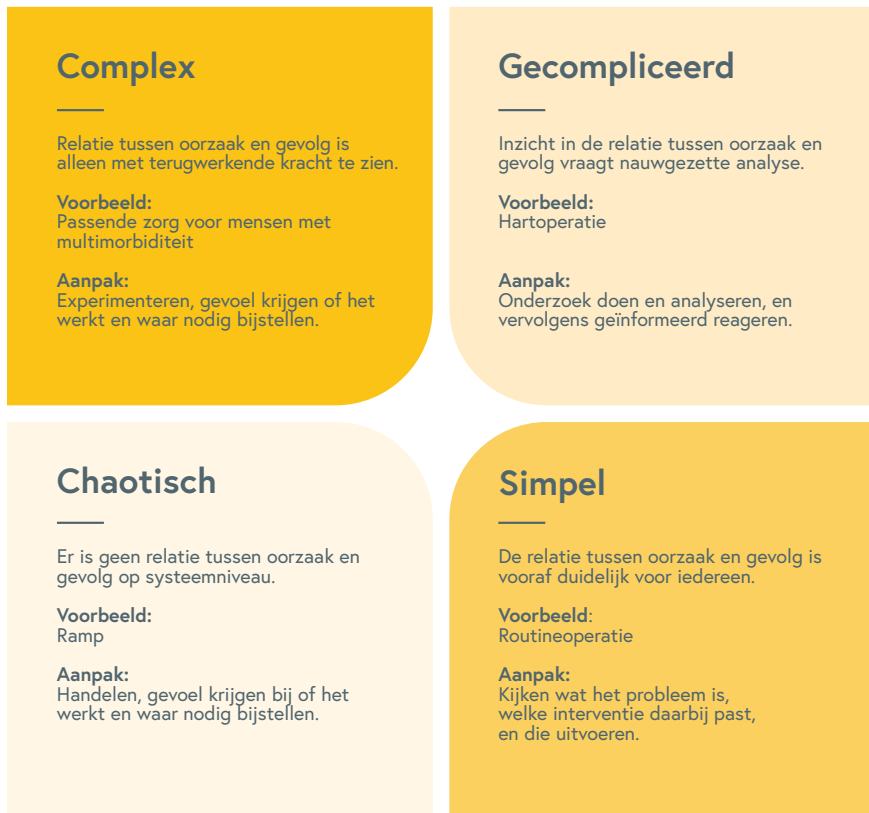
Figuur 2 Het Cynefin raamwerk

kijken wat werkt en wat niet; daar waar nodig beleid bijstellen; en zo oplossingen als het ware uit de praktijk laten opkomen (zie ook het kader hieronder).